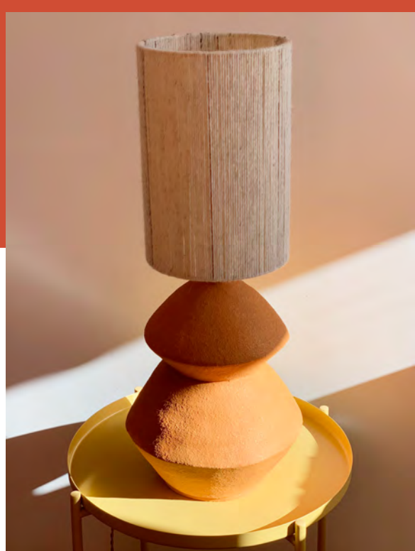
Rif - 01

Surface, un atelier de création de céramique et tissage. Une collection de pièces uniques façonnées à la main.