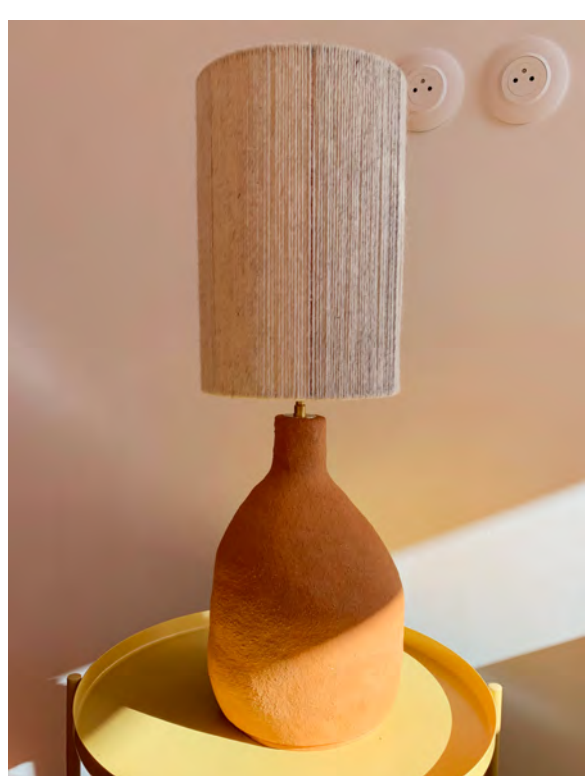
Rif - 02

La collection « rif » est une série de luminaires. Le pied de lampe est façonné au colombin avec de la terre primitive chamottée incrustée de micas et l'abat jour composé de fils de laine couleur écru avec des légères variations de teintes.