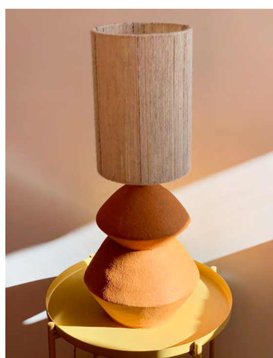
Rif - 01

Lampe de sol fabriquée artisanalement en France.